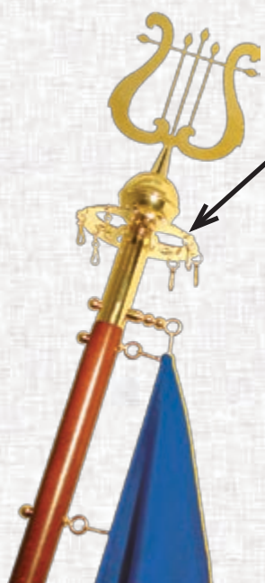
D.3 dodatni obroč za izobešanje večih spominskih trakov