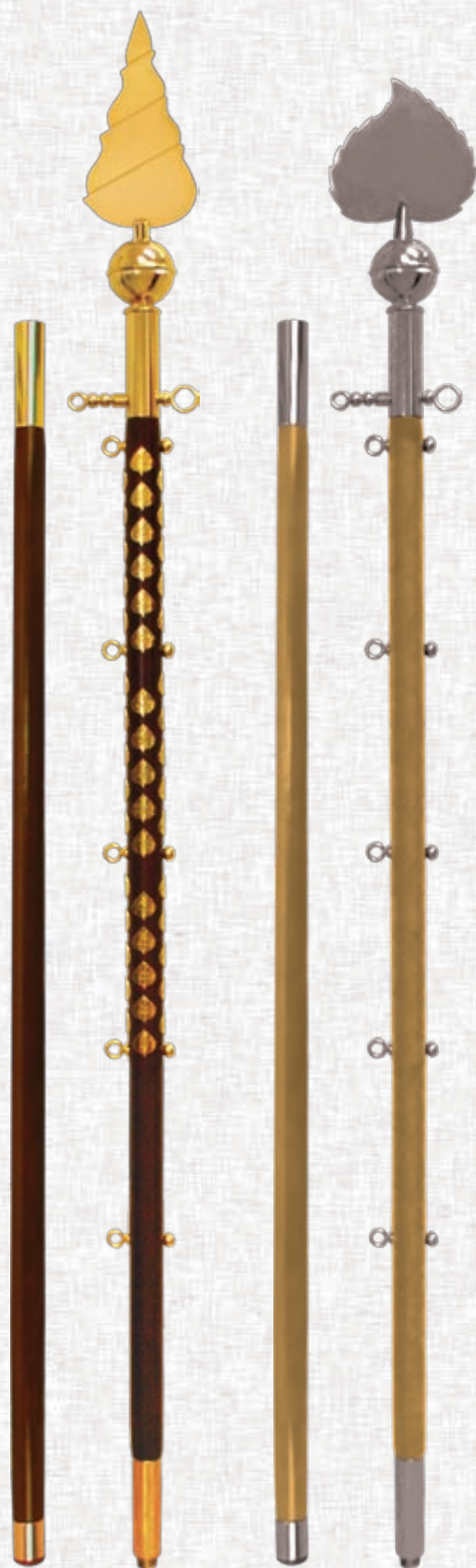
drog iz temnega lesa z zlatimi elementi