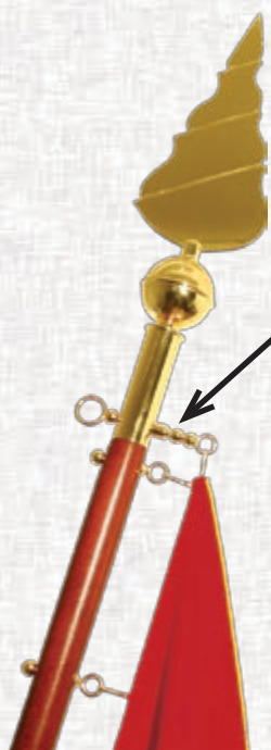
D.2 drog s podaljšanim vijakom, ki omogoča lepše nošenje prapora