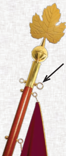
D.1 standardni drog z vijakom za obešanje spominskih trakov

Vsi kovinski deli so izdelani iz medenine, so pozlačeni ali kromirani in zaradi boljše obstojnosti zaščiteni z lakom.